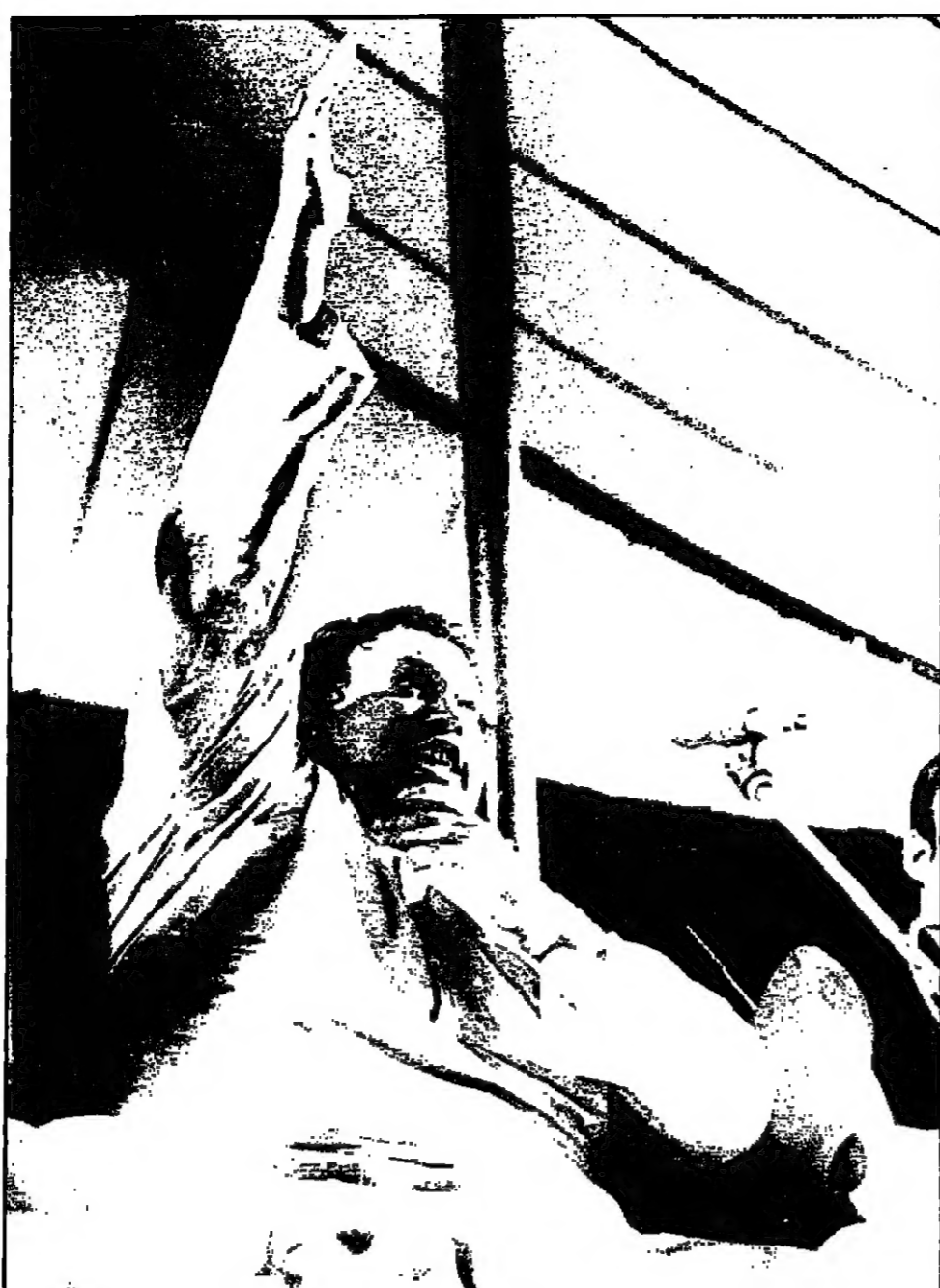
نصرت علي خان